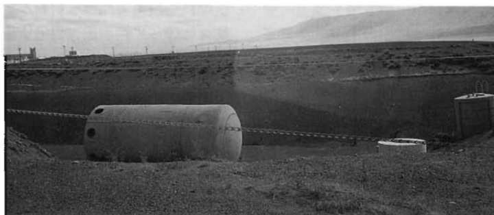
リッチランド廃棄物処分場での SHIPPING PORT 炉

一方、DOE(エネルギー省)は政府機関の施設を所掌し、1989年に30年間で約2000億ドルを投入し、環境修復と廃棄物管理をめざした環境修復計画を発足させています。対象施設は7000施設のものばり、オークリッジ研究所のウラン濃縮工場、ハンフォード地区のプルトニウム生産炉、パンテックス工場の核兵器解体など、また汚染した土壌や地下水のクリーンアップも大きな作業で、地球を相手にした新しい技術開発も進めています。アメリカはまさに廃止措置の先進国になっています。